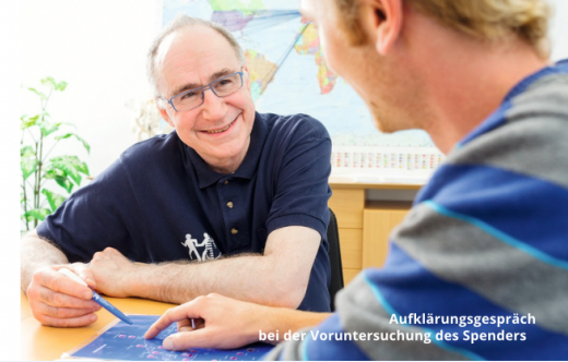
Aufklärungsgespräch bei der Voruntersuchung des Spenders