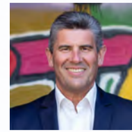
Horst Kratzer Bürgermeister von Postbauer-Heng Schirmherr der Typisierungsaktion