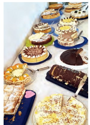
Impressionen von Typisierungsaktionen der Stiftung AKB