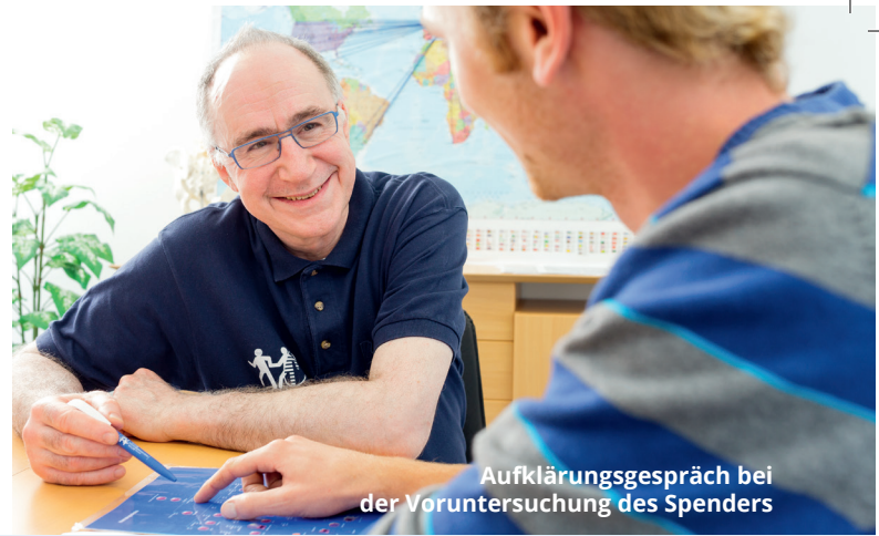
Aufklärungsgespräch bei der Voruntersuchung des Spenders