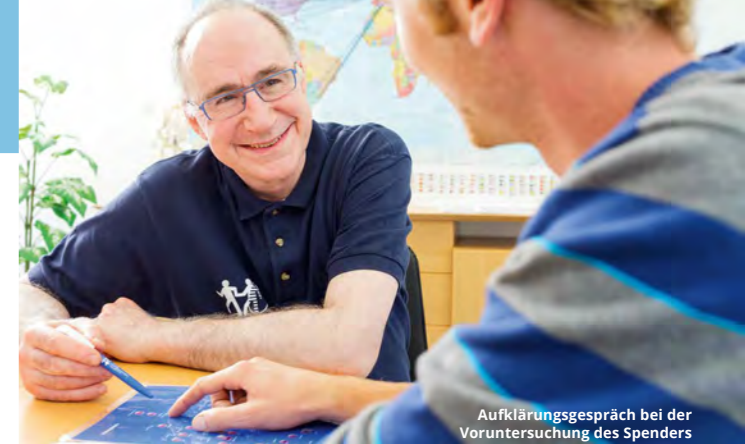
Aufklärungsgespräch bei der Voruntersuchung des Spenders