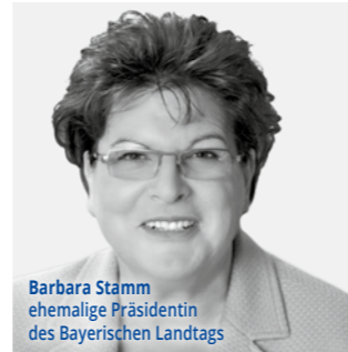
Barbara Stamm ehemalige Präsidentin des Bayerischen Landtags