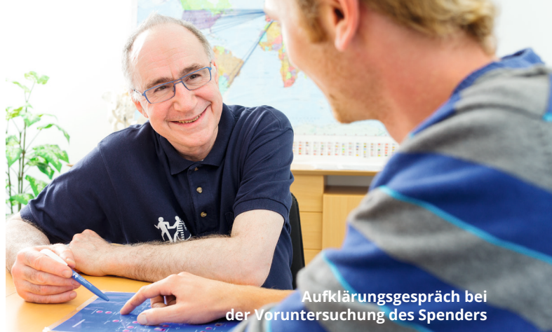
Aufklärungsgespräch bei der Voruntersuchung des Spenders