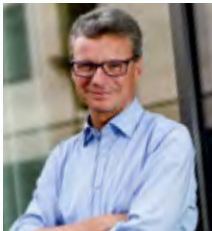
Bernd Sibler Bayer. Staatsminister für Wissenschaft und Kunst, Schirmherr der Aktion