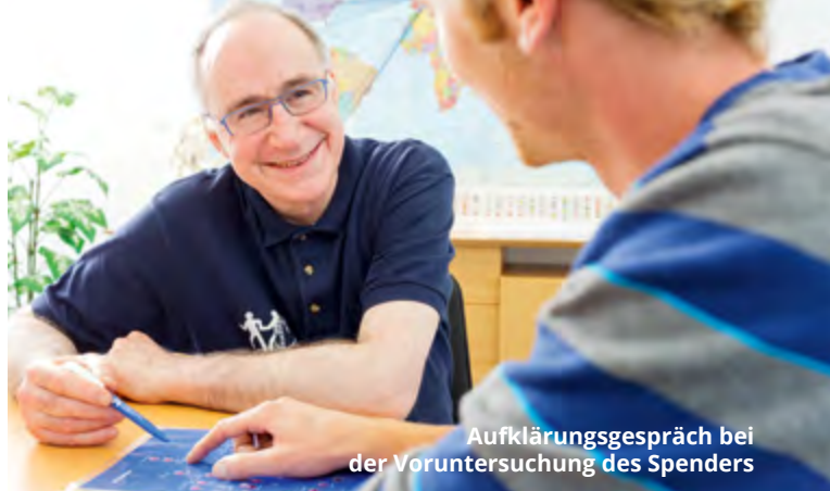
Aufklärungsgespräch bei der Voruntersuchung des Spenders