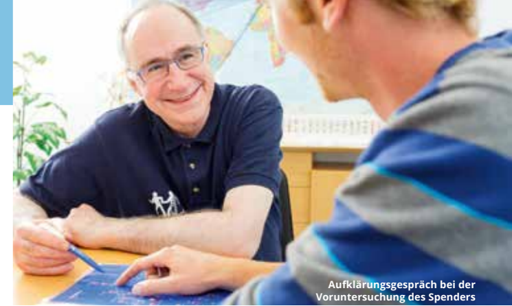
Aufklärungsgespräch bei der Voruntersuchung des Spenders