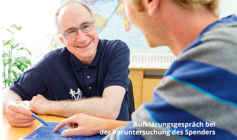
Aufklärungsgespräch bei der Voruntersuchung des Spenders