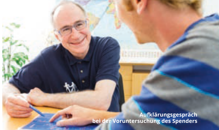
Aufklärungsgespräch bei der Voruntersuchung des Spenders