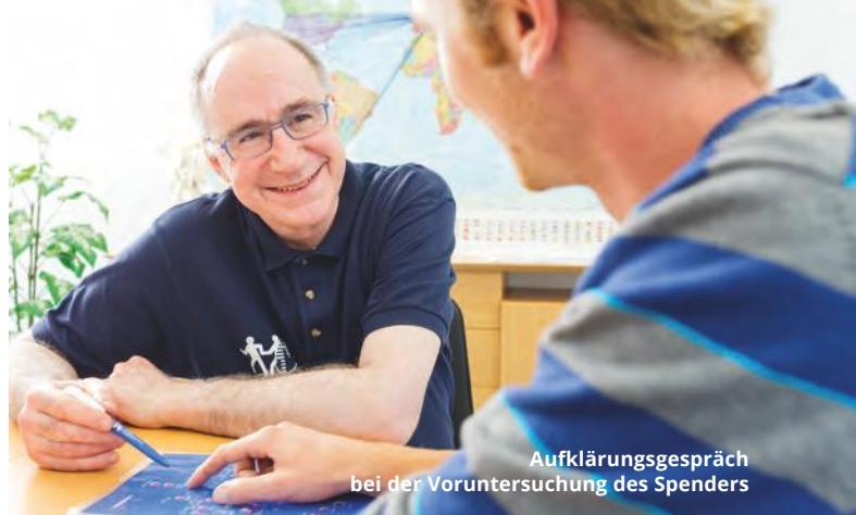
Aufklärungsgespräch bei der Voruntersuchung des Spenders