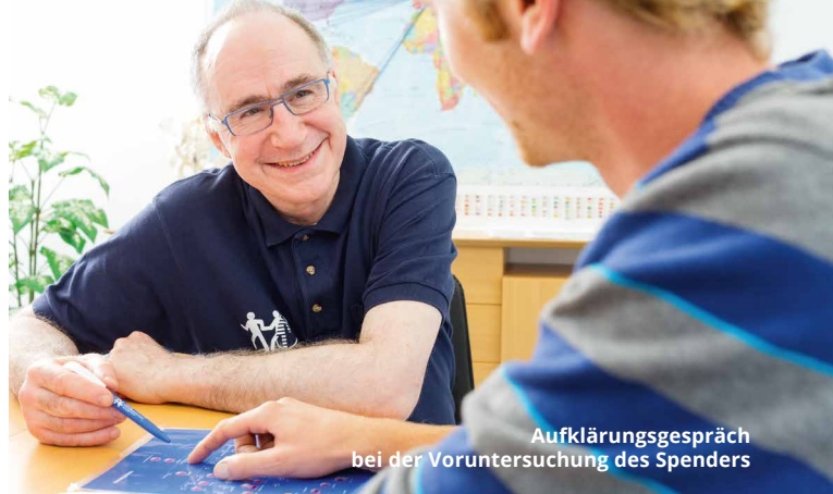
Aufklärungsgespräch bei der Voruntersuchung des Spenders