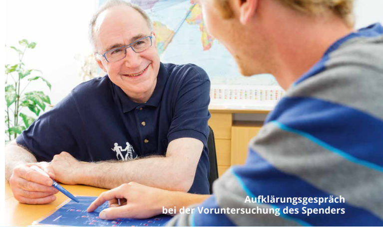
Aufklärungsgespräch bei der Voruntersuchung des Spenders