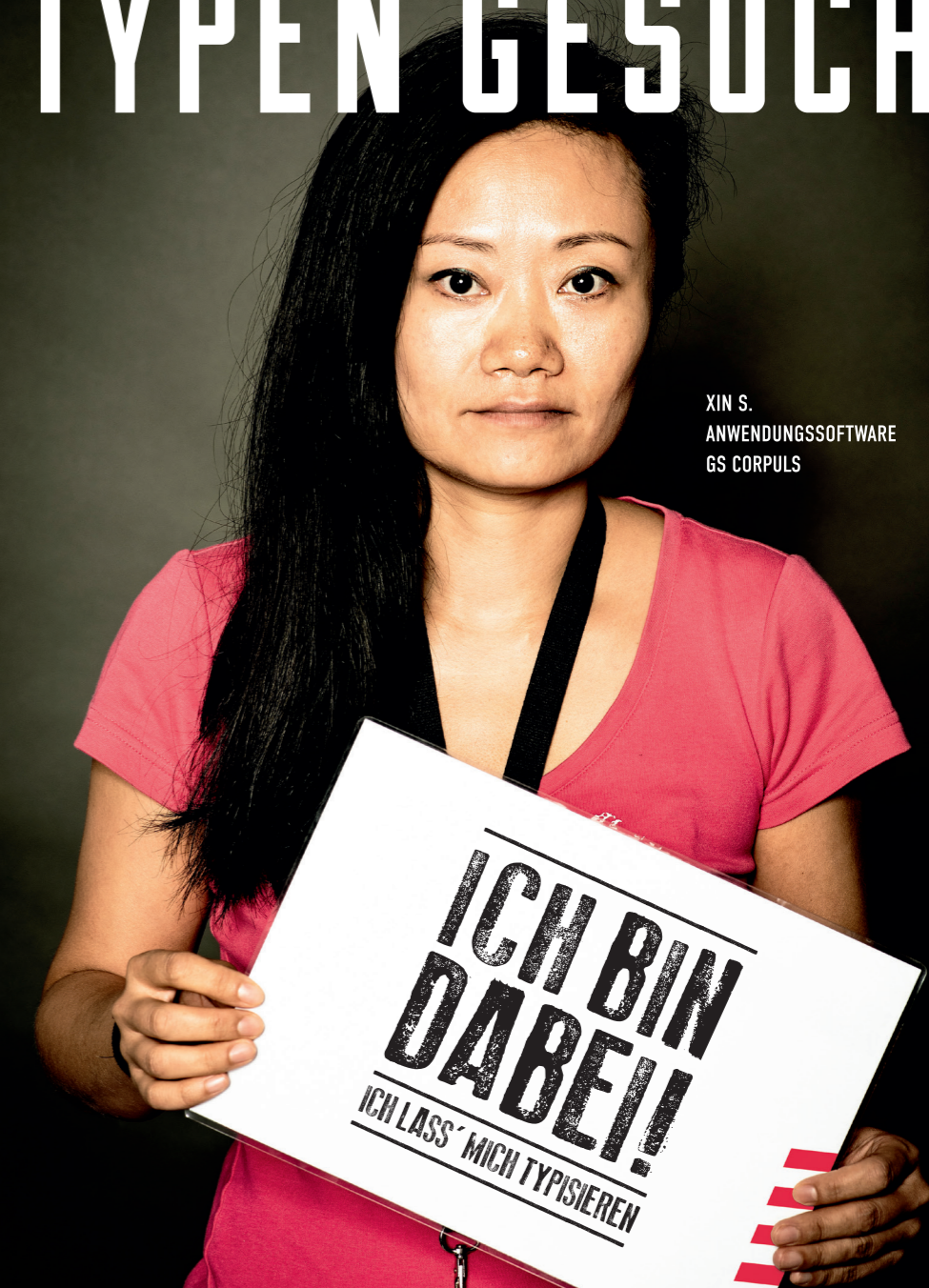
XIN S. ANWENDUNGS SOFTWARE GS CORPULS