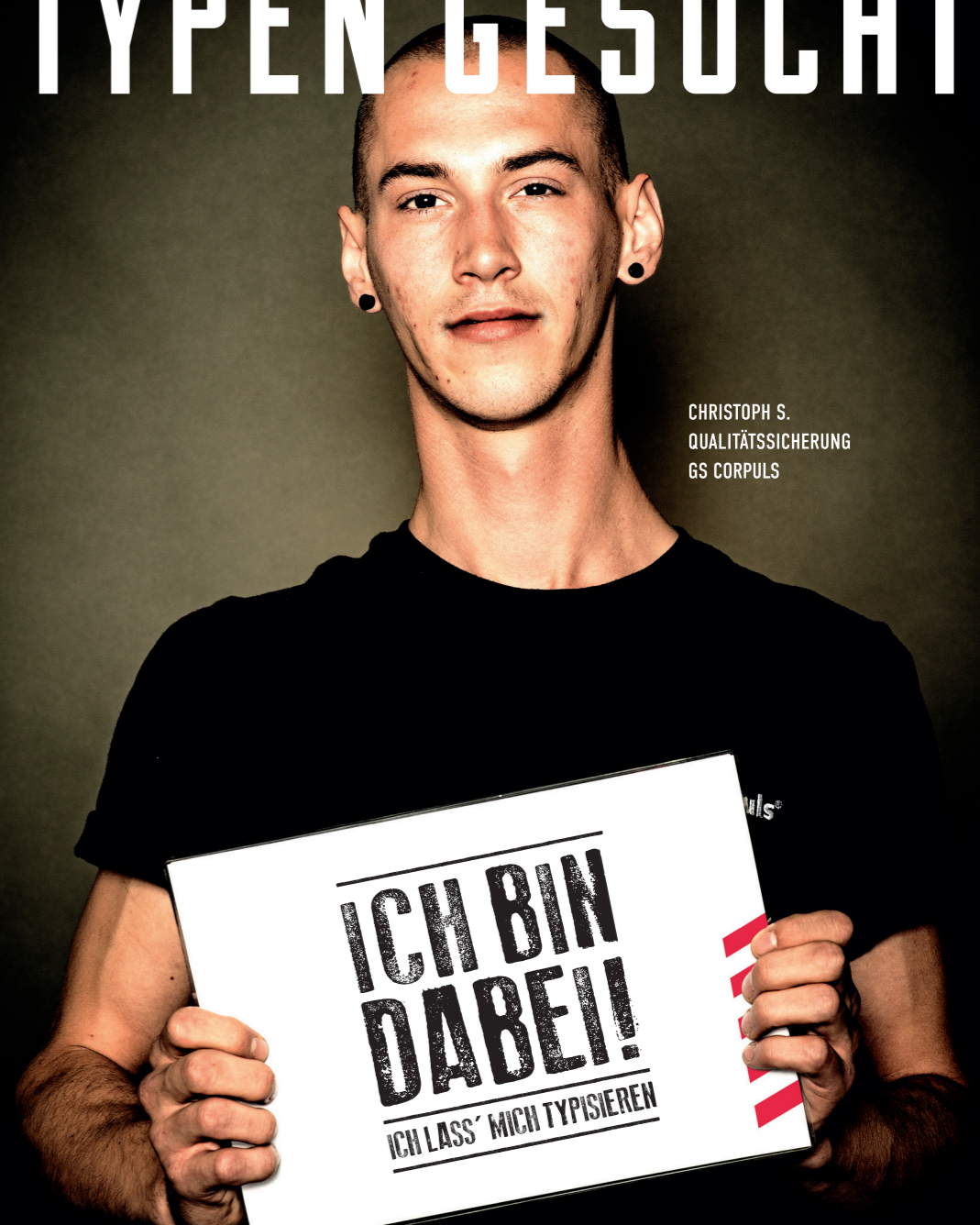
CHRISTOPH S. QUALITÄTSSICHERUNG GS CORPULS