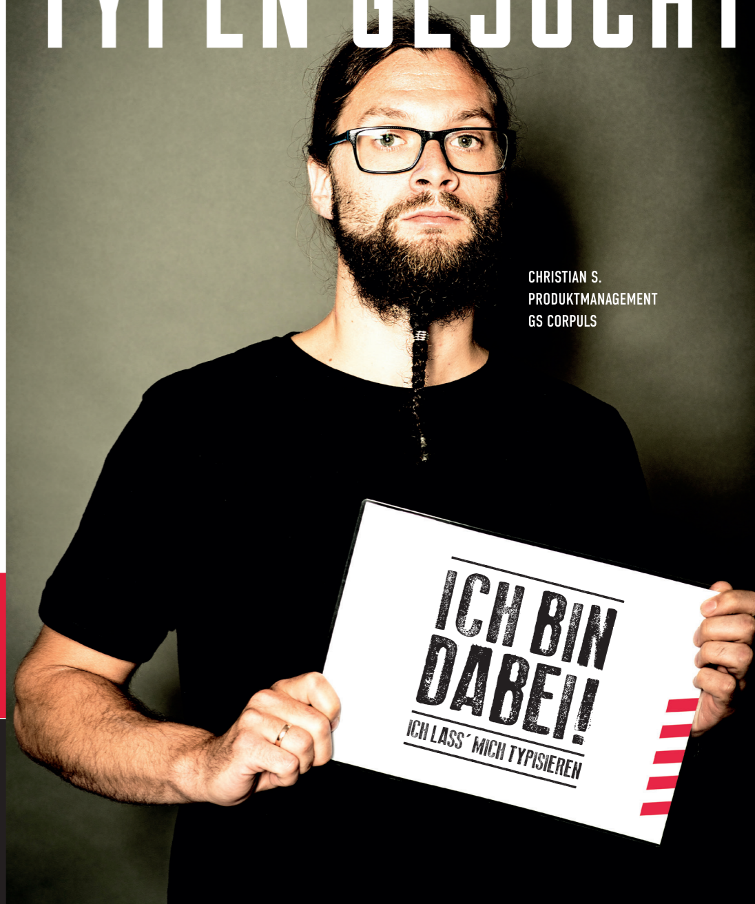
CHRISTIAN S. PRODUKTMANAGEMENT GS CORPULS