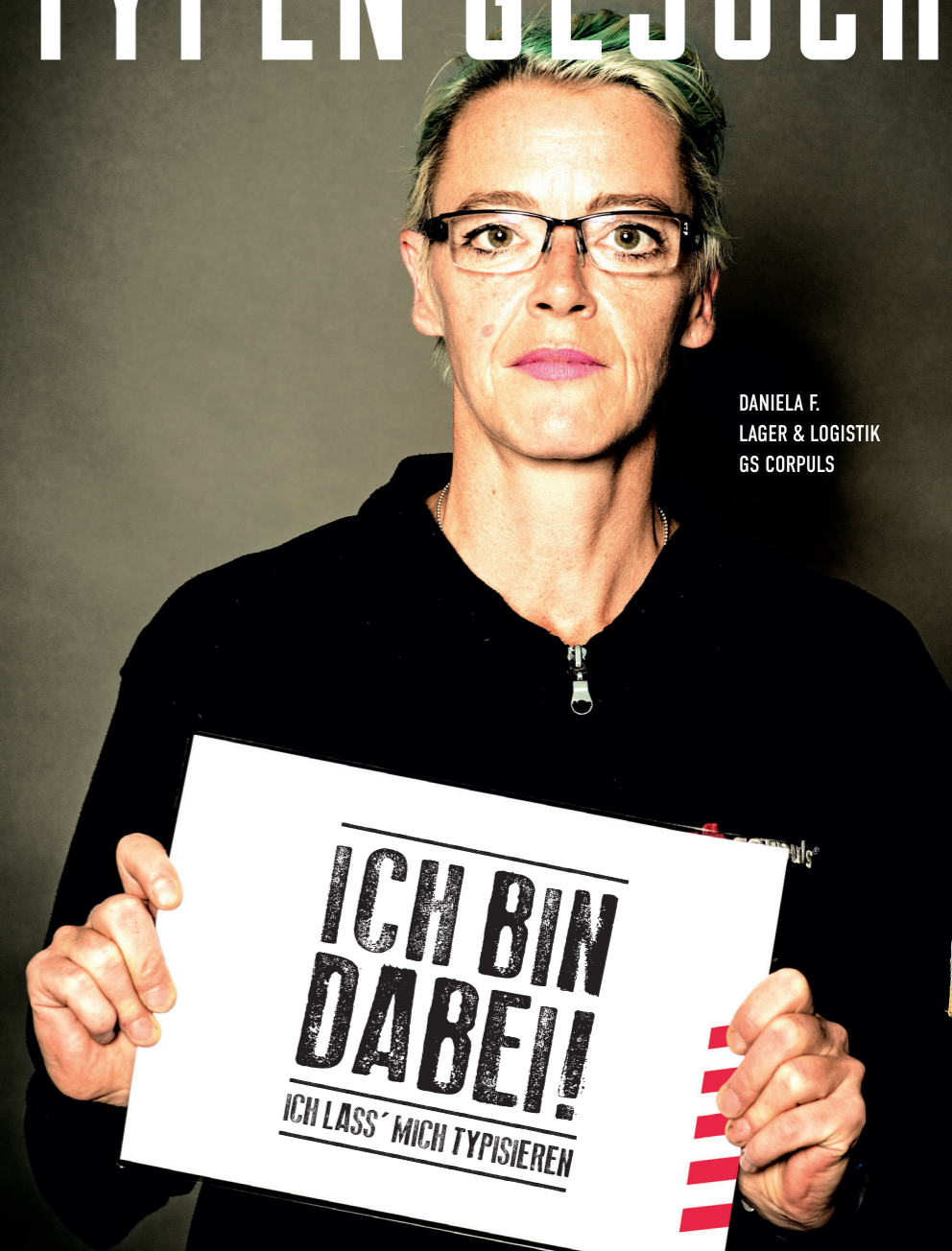
DANIELA F. LAGER & LOGISTIK GS CORPULS