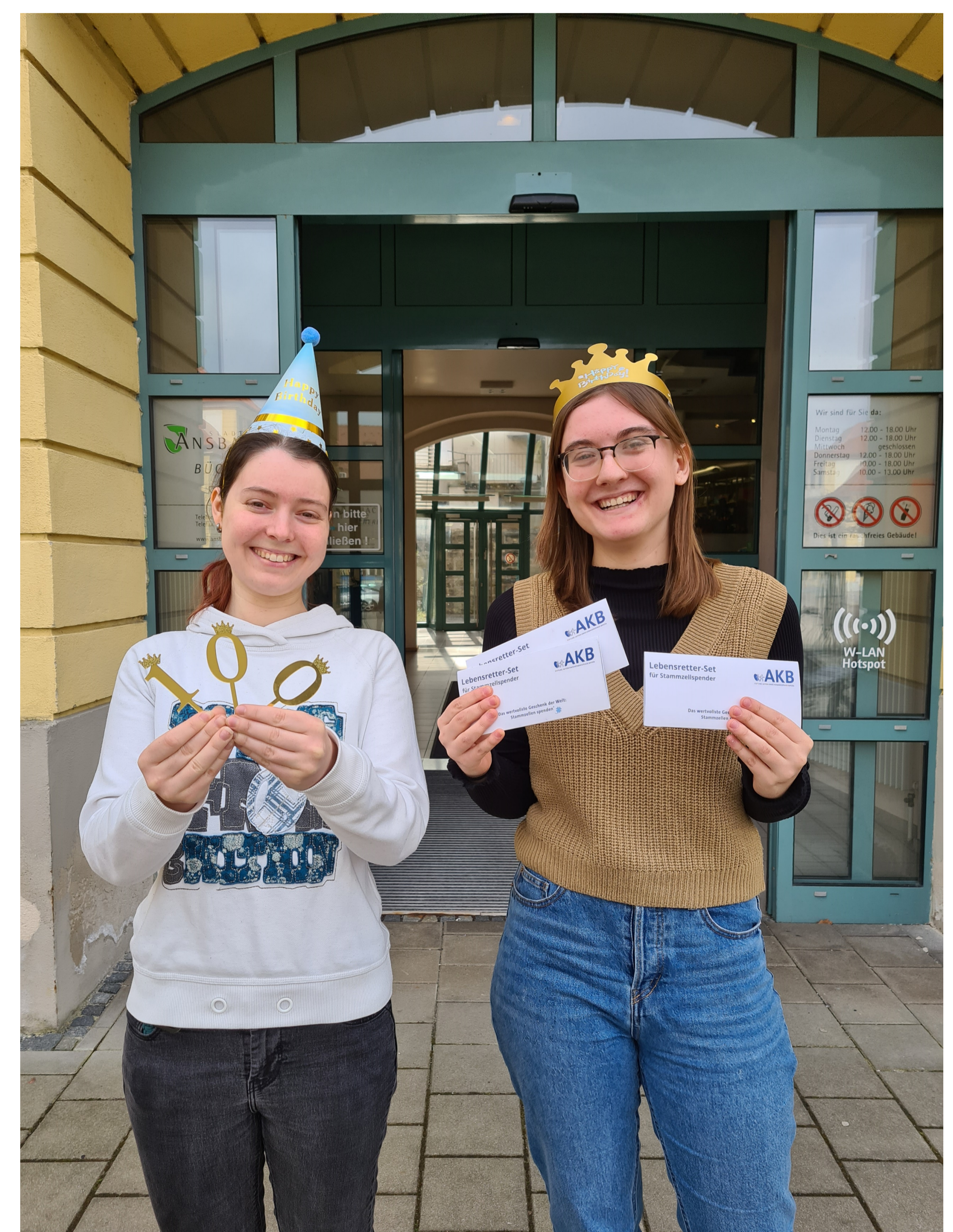
100 Jahre Stadtbücherei Ansbach – 100 neue potenzielle Lebensretter?

Unterstützen Sie uns mit Ihrer Geldspende! Jede Erstregistrierung kostet die Stiftung AKB 35 Euro.