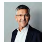
Herbert Hainer Präsident des FC Bayern München Schirmherr der Typisierungsaktion