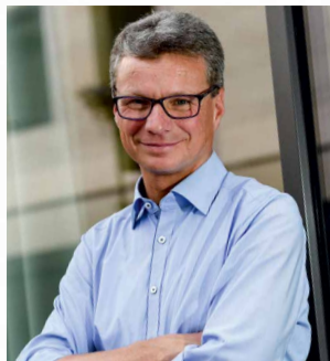
Bernd Sibler Bayer. Staatsminister für Wissenschaft und Kunst, Schirmherr der Aktion