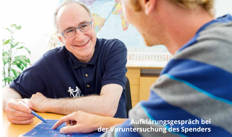
Aufklärungsgespräch bei der Voruntersuchung des Spenders