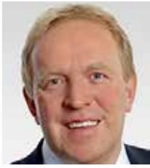
Volker Bauer Landtagsabgeordneter