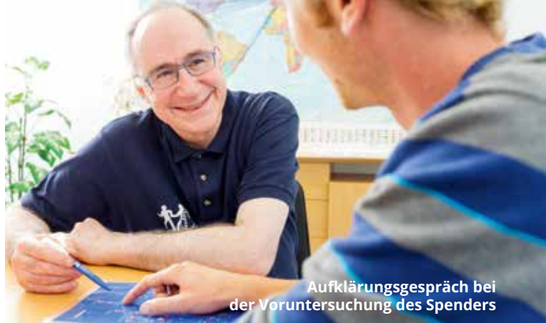
Aufklärungsgespräch bei der Voruntersuchung des Spenders